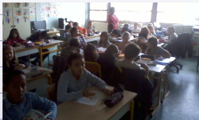
Zone 3 : CM1