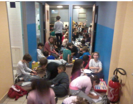
Zone 4 : CE2 et CM2