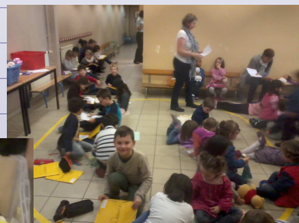
Zone 1 : maternelle et CP J

Suite à l'exercice de confinement à la veille des vacances de Noël, la maîtresse tente de faire reformuler ce qui vient d'être vécu: